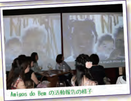
Amigos do Bem の活動報告の様子