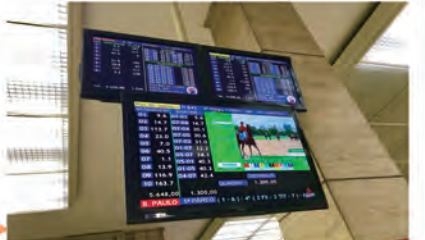
馬券カウンターとオッズが表示されるモニター