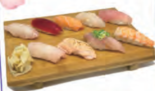
夜メニューのお寿司(55レアル)