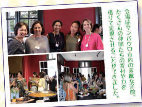
会場はサンパウロ市内の素敵な洋館。たくさん仲間たちの寄付や力を借りて実現させることができました。

(チャリティーイベントや Amigos do Bem に関して、詳しくは以下の駐妻キャリア net ホームページをご覧ください。)