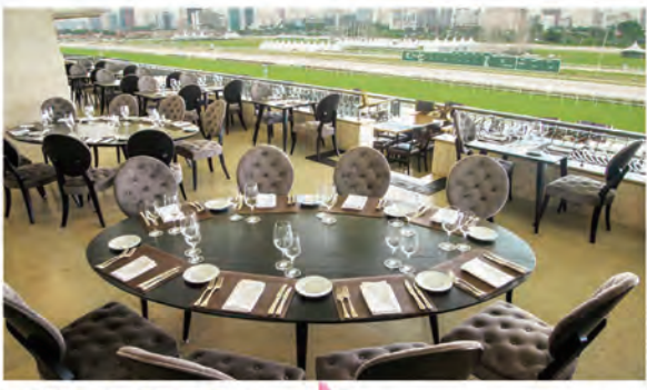
レストラン Vila Jockey ☆ 公式 HP より