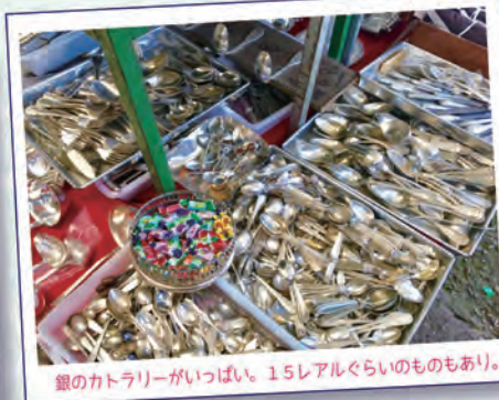
銀のカトラリーがいっぱい。15レアルぐらいのものもあり。

大小50以上のお店がテントの下に並び、大きな家具から、陶器、銀食器、レコード、ミリタリーグッズ、宝石類、コイン類、オブジェなどあらゆるものが並び、一つ一つじっくり見ていると1時間以上はかかってしまいます。何度も通って掘り出し物を見つけるのも楽しみ。気になるものを見つけたら、お店の人に値段交渉をしてみましょう。ヨーロッパなどのアンティーク市よりも安いのも初心者にはお買いものしやすいところ。編集部には、アンティークのティーカップを集めている子、お気に入りの銀のカトラリーを集めている子もいます。あなただけの宝物を見つけてみてはいかがでしょうか？