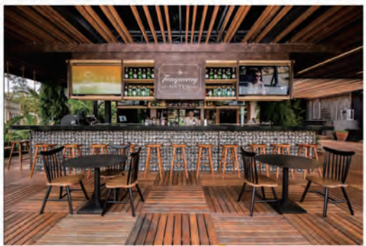
レストラン Ferra Jockey ☆ 公式 Instagram より

3つ目のレストランは、一番奥、競馬コースのコーナー近くに位置する「Iulia」。ピュッフェを中心としたメニ