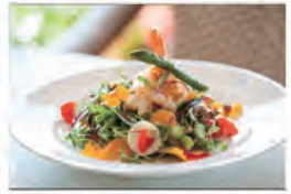
レストラン Iulia 公式 Instagram より