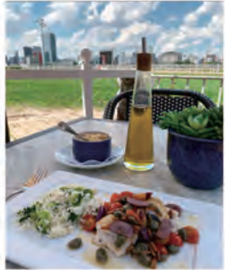
レストラン Iulia 公式 Instagram より

ューですが、日替わりでフェジョアアダなどの単品メニューもあるようです。お料理は、ブラジル&地中海料理。巨大なバリエーションが有名です。こちらもテラス席があり、コースの美しい芝生を見ながらお食事ができます。テラス席ご希望の方は事前に予約をしましょう。夜は、結婚式などのパーティーに使われることもあるようですが、通常のお食事もできるとのこと。今回お食事はしなかったのですがSNS上でお料理が一番美味しそうなレストランでした。