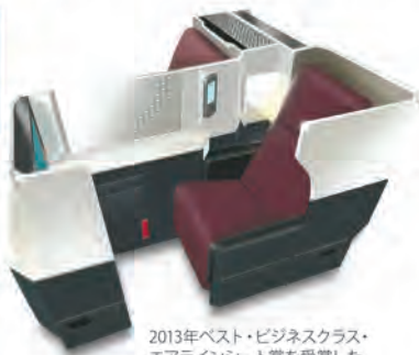
2013年ベスト・ビジネスクラス・エアラインシート賞を受賞した「JAL SKY SUITE」

JALのネットワークなら、米国経由および欧州経由の多彩なフライトオプションからお客さまのニーズに合わせてお選びいただけます。また、JAL国際線ビジネスクラスでは、プライバシー性を高めたゆとりあるフルフラットシート「JAL SKY SUITE」で、上質な空の旅をお過ごしいただけます。