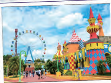
テーマパーク Hopi Hari