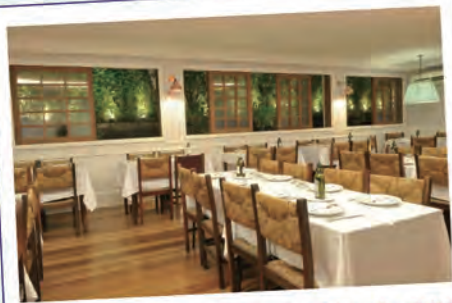
Moena 店もありますが、できれば Bixiga で味わいたい味です！

「Speranza Bixiga」住所：Rua 13 de Maio, 1004