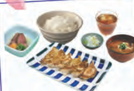
特性餃子定食(31.50レアル)