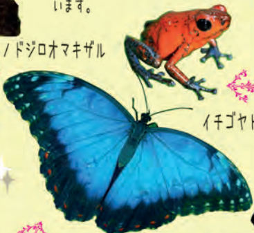
イチゴヤドクガエル