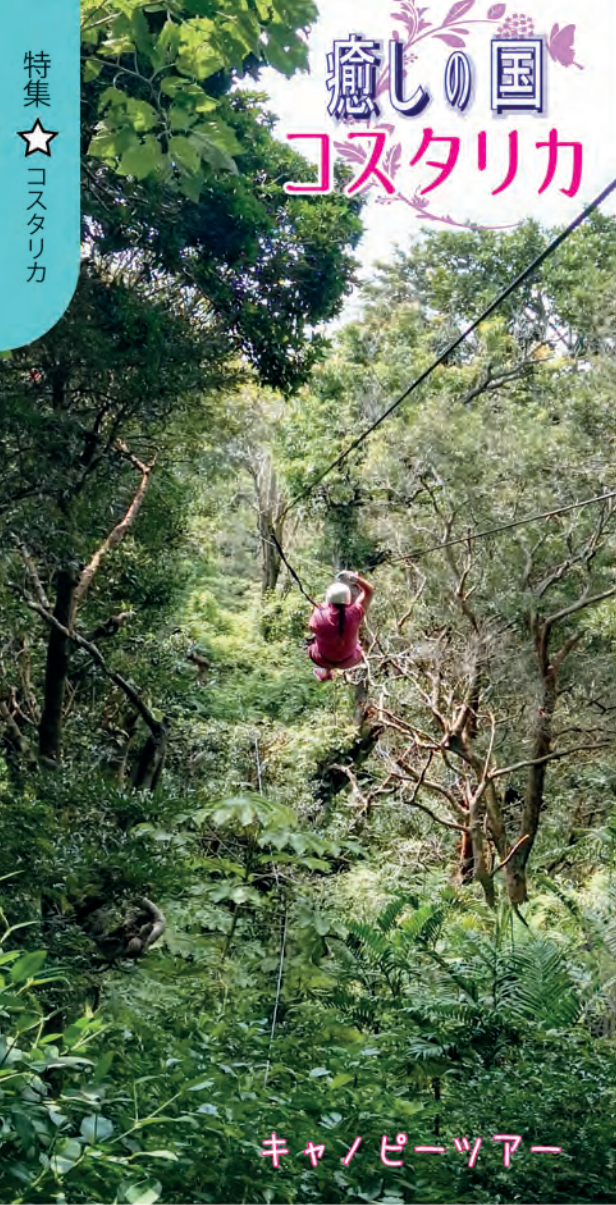
キャノピーツアー