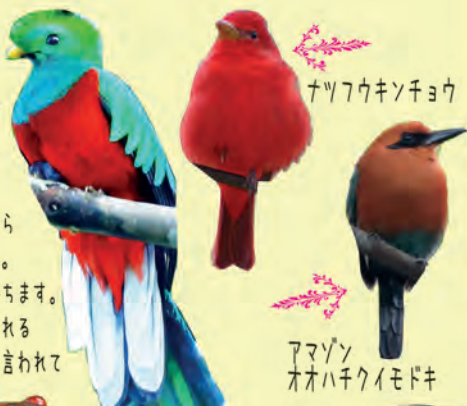
アマゾン オオハチクイモドキ

その美しい色と優雅な容姿から 幻の鳥と呼ばれるケツァール。 オスはより長く美しい尾を持ちます。 手塚治の「火の鳥」でも知られる 鳳凰のモデルとなった鳥とも言われて います。