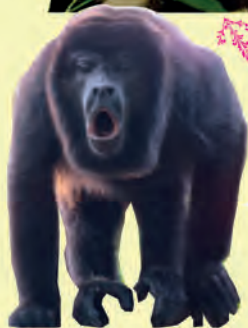
ノジロオマキザル