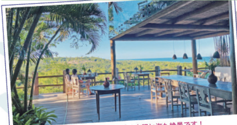
ホテル兼レストラン。テラスから見る夕陽と海も絶景です！