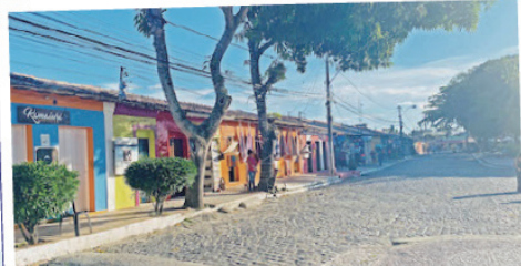
繁華街Rua Mucugéお土産物屋さんやレストランが軒を並べています。