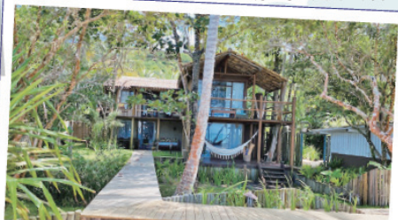
小規模の人気ホテルやロジックは早めの予約が必要です！

さらに、ホテルも繁華街から離れたものも多いので、町の中心部のホテル以外は、滞在するホテルかその周辺のホテルで食事をすることを念頭に計画を立てましょう。もちろん、ポルトセグロからレンタカーで移動することも可能。CLUB MEDのホテルに宿泊される方は、ポルトセグロ空港までお迎えが来るので、荷物が多い方や小さなお子様連れで滞在したい方にはオススメです。