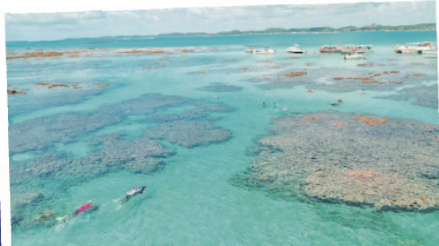
マラゴジの天然プールツアーは通常3つの天然プールポイントを巡りますが1箇所の滞在時間が長いのがポイントです。

お客様の満足度も高いホテルです。そして予約が取りにくいホテルなので、早めのご予約が必須です。マラゴジはポルト・デ・ガリーニヤスから弾丸の日帰りツアーで訪れる方も。その場合も、1日タクシーを押さえて往復するのがお勧めです。(★価格交渉が必要です。H.I.S.も手配の経験がございますので、お問合せください。) トップの写真は、Caminho de Moisesと呼ばれる引き潮の時に現れる砂の道。1か月に15日くらい、かつ1日2時間の間見られます。