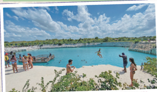
Buraco Azul Caiçara. レストランも併設しているのでお食事をしながら湖遊びを楽しむことも可能です。(料金は高め。入場料がかかります。)

トップの写真はビーチパークと呼ばれる人工湖。入場料を払って滞在や湖でハンモックや水遊び、アクティビティ、お食事を楽しむ施設で、宿泊することも可能です。最も人気なのはLagoa do Paraíso。1日に複数のビーチパークを巡るツアーもありますが、どこも同じような施設なので、ツアーに参加するのではなく1日1-2箇所に限定してゆっくり滞在するのがオススメ。ジェリコアコアラは砂の反射が激しいので、日焼け止めやサングラス(砂ボコリを避けるためにも重要です)、日よけの帽子、日焼け止め、ビーチサンダルは必須。1年中楽しめるスポットですが、次ページのベストシーズン表もご参考ください。