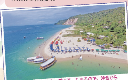
Gamboa ビーチ。クルーズツアーもあるため、沖合から美しいビーチと景色を楽しむことも。

空港からサルバドールの旧市街にある船着場(Tourist Terminal Náutico da Bahia)へUberにて移動(約50分)船にてモーホ・デ・サンパウロまで約2時間(船は事前予約が必要ですが、天候により船が出ない場合も。) モーホ・デ・サンパウロの港からホテルへの移動はUberが利用できません。タクシーも待機していない場合があるため、宿泊ホテルまでの移動は事前手配必須。滞在するホテルまたはHISブラジルへにて送迎車の事前手配をおすすめいたします。