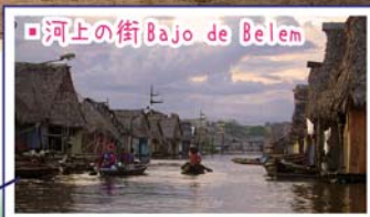
河上の街 Bajo de Belem