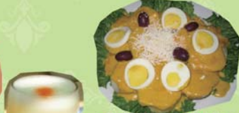
パパアラワンカイナ