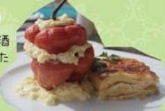
ロコト・レジェナード