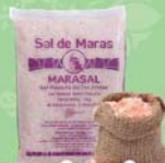
マラス塩田の塩 & キヌア&チョコ

食では、マラス塩田の塩、キヌアやチョコレート、インカコーヒー、アマゾンで取れる健康油インカインキオイルが有名。お酒好きな人にはぜひピスコを！！