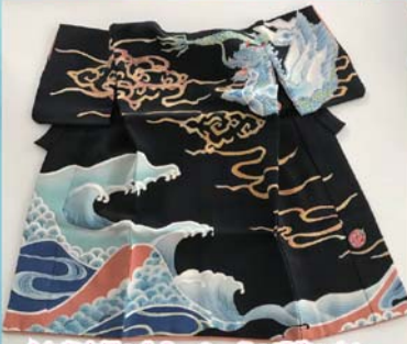
↑加賀友禪の作品 8ヶ月の研修のあと