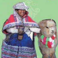
もふもふアルパカ&ビクーニャ製品

ペルーと言えば、やっぱりアルパカやビクーニャ。もふもふの柔らかい毛を使ったセーターや靴下、ニット帽、ぬいぐるみなど様々なアイテムが売られています！