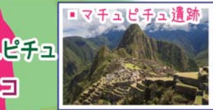
マチュピチュ遺跡