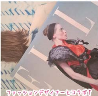
ファッションデザイナーとコラボ!