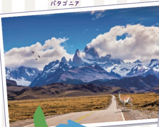
ペリトメロノ氷河

観光のベストシーズンは12月から2月。日照時間も長く、最高気温10℃~15℃と気候も安定しているので、観光を長く楽しむこともでき、トレッキングなどのアクティビティーにも参加しやすいのが特徴です。