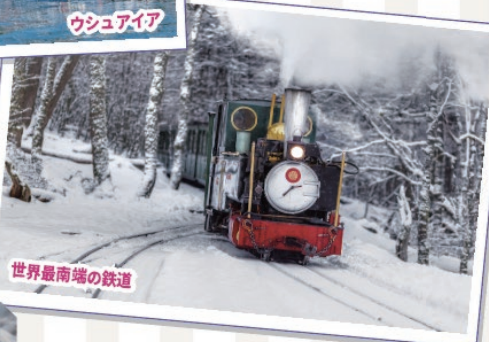
世界最南端の鉄道

ブエノスアイレスで堪能できる焼肉アサードの他に、パタゴニア観光では蟹など美味しい魚介も堪能できるのも魅力の一つ。カーニバルなど時間に余裕がある連休にぜひ計画を立ててみてくださいね!